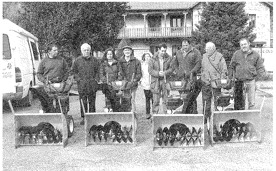
Posando con las quitanieves.

Las quitanieves recién adquiridas fueron financiadas poniendo el Ayuntamiento el 75% y las cuatro Juntas Vecinales el 25% restante. Son máquinas robustas especialmente preparadas para el frío y con sistema de arranque a baja temperatura enchufándolas a la red. Disponen de una lanzadera ajustable 180°, con lo que se podrá lanzar la nieve en el lugar deseado y seis velocidades de avance además de marcha atrás.