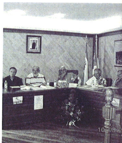
Miembros del jurado.